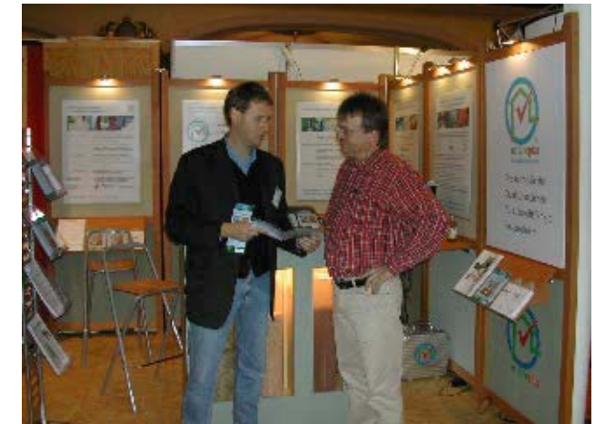
Zum Erfolg in der Öffentlichkeit haben auch die Messeauftritte - hier bei der TREND in Heidelberg - beigetragen.

Im vergangenen Jahr erschienen zahlreiche Veröffentlichungen von und über natureplus: In der deutschen Publikumspresse waren es 95 Artikel mit einer Gesamtauflage von 9,12 Mio. Exemplaren, in der deutschen Fachpresse waren es 90 Artikel mit einer verbreiteten Auflage von 7,05 Mio. Exemplaren. Im deutschsprachigen Ausland erschienen 25 Artikel mit zusammen 1,55 Mio. Exemplaren. Dazu noch 0,61 Mio. Internet-Kontakte sowie ein ausführlicher TV-Beitrag mit etwa 1,8 Mio. Zuschauern. Zu diesem überwältigenden Presseecho haben auch Partner von natureplus beigetragen; insbesondere danken wir dem WWF Schweiz und dem BUND in Deutschland, die in zahlreichen Pressemitteilungen natureplus erwähnten.